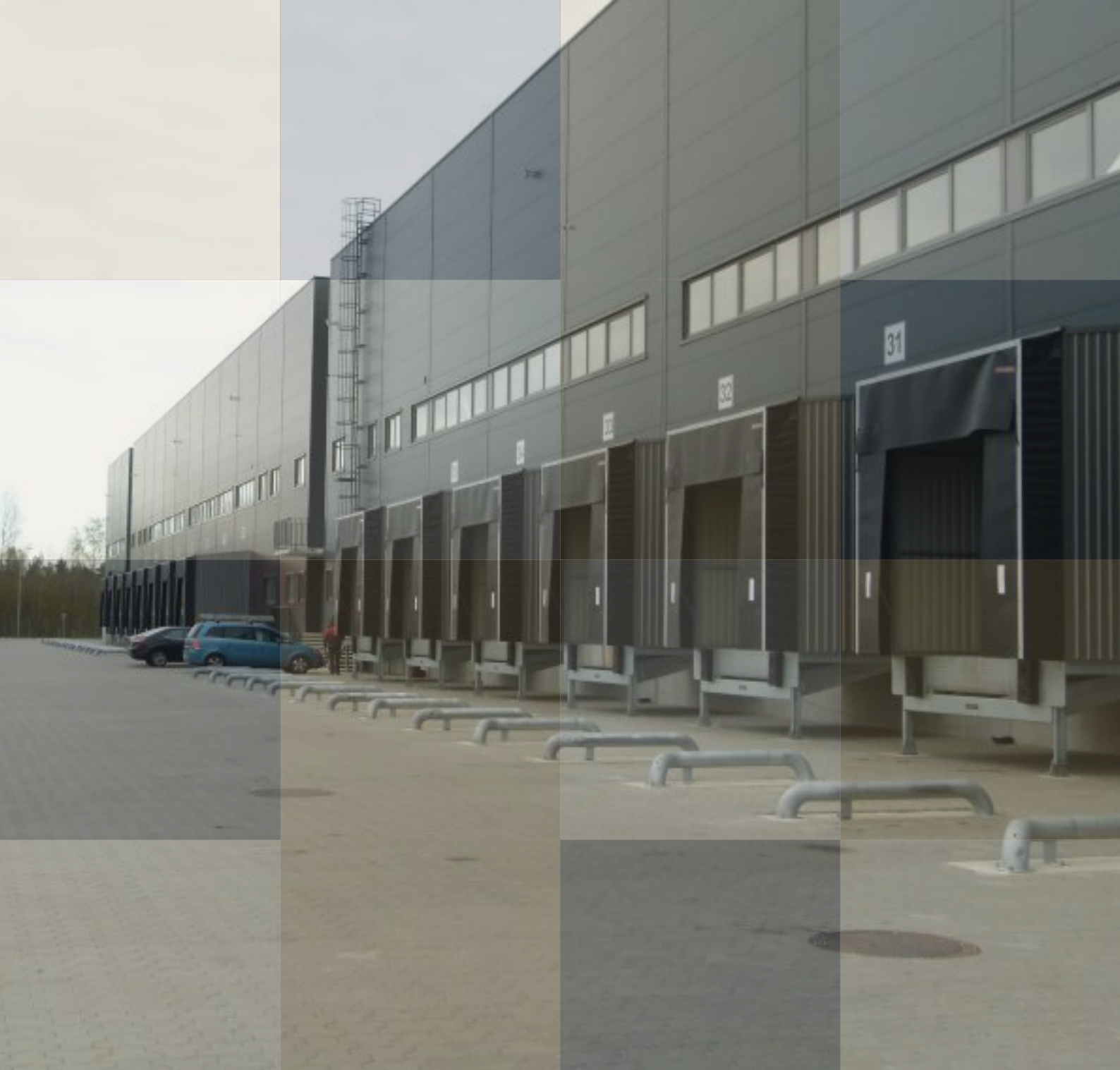
K4 Group produktų sandėliavimo vieta Kauno rajone, moderniuose A+ klasės sandėliuose.